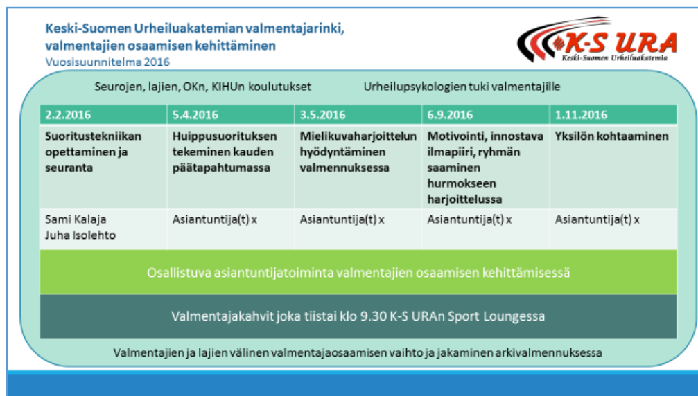
Kuva 1: Valmentajaringin toimintasuunnitelma 2016.